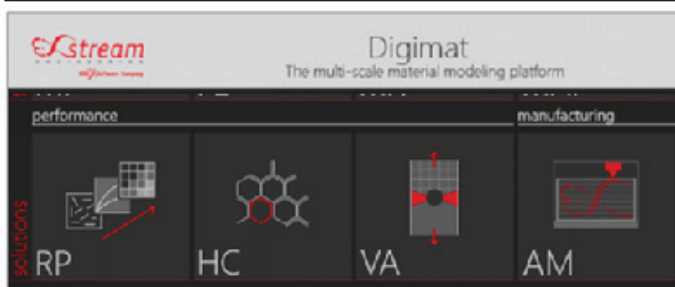
2. ábra. Digimat AM szoftvercsomag moduljai

Lehetővé teszi a mérnökök számára a nyomtatott darab vetemedésének, a hőmérséklet viszonyoknak és a maradó feszültségeknek a vizsgálatát a nyomtatási paraméterek és az anyagválasztás függvényében. A Digimat AM szimulációk segítségével a nyomtatási beállítások optimalizálhatók, még a fizikai nyomtatás előtt, például a megfelelő vetemedés kompenzáció azonosításával. A szoftver egyszerű és hatékony munkafolyamatot biztosít, a nyomtatási projekt definiálásától kezdve, a különböző gyártási paraméterek beállításával, a szimuláció beállításával és az eredmények kiértékelésével (2. ábra).