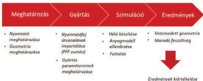
3. ábra. Digimat-AM szimuláció főbb lépései

A Digimat AM által számított eredmények jó egyezést mutatnak a valóságban kinyomtatott kocka vetemedésével. Az alsó szintekben bekövetkező változásokat karima hozzáadásával lehet csökkenteni, vagy megszüntetni, mivel azzal növelhető az alap