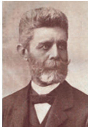
Czekelius Aurél [3] (1844. okt. 5., Csiklovabánya – 1927. nov. 14., Budapest)

Édesapja Czekelius Frigyes, az osztrák-magyar államvasúttársaság resicai uradalmának és bányáinak vezérigazgatója. Középiskoláit Temesváron végzi. A műegyetemen 1869-ben diplomát szerzett szakember a korát meghatározó fejlesztési vonulatába, a vasútépítésbe kapcsolódik be. Ezt követően a neves hídépítők csoportjának egyik jelentős képviselőjévé válik. Ne feledjük, hogy a XIX. század második fele a „vasútépítés aranykora”. Ezt szemlélteti a Vasúti lexikon [1] adatai alapján összeállított lenti ábra [2], amely az akkori Magyarország vasútvonalának növekedését jellemzi. Így nem véletlen, hogy Czekelius Aurél egyik első, 1874-ben megjelent közleménye is a közetek szilárdsági tulajdonságaival foglalkozik [4]. Budapestre visszatérve különböző minisztériumi beosztásokban fokozatosan a vasútvonalaktól nem független hidak [5,6] építésének és tervezésének irányítója, egyik vezető egyénisége. Életének főbb mozzanatai a következőkben foglalható össze [7-10]: