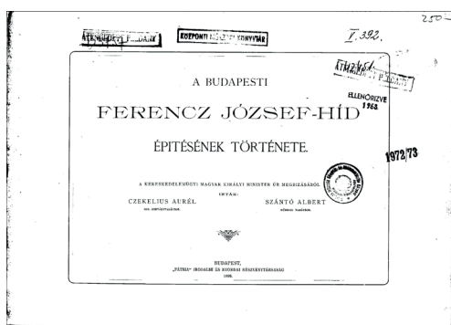
Czekelius Aurél, Szántó Albert: A budapesti Ferencz József híd építésének története. Budapest, 1896, Pátria [14]

Az 1905-ben történt nyugdíjazását követően visszavonultan élt, tevékenységéről viszonylag kevés adat található. Ennek oka alapvetően egyéniségéből és életviteléből következik [10]. Búcsúbeszédében Gállik István ezt a következő mondatokkal jellemzi: